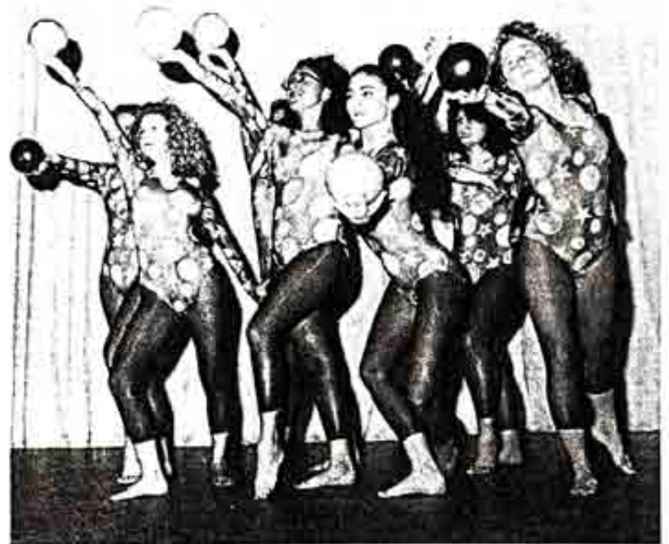
Un gruppo di ginnastica e danza femminile della «Concordia».

Quali sono secondo lei le differenze sostanziali tra le due Società al giorno d'oggi? «Per quanto riguarda la mia società direi una società di carattere e di ambiente prettamente familiare. Quindi s'inserisce in un contesto completamente differente da quello che magari s'innesta la Federale. D'altra parte la Concordia è più attiva per quanto riguarda l'attività popolare. Quindi il podismo e da questo è nata anche l'Associazione Sportiva Ticinese (ASTI). La Concordia ha prevalentemente un indirizzo sociale, benché espliciti un'attività ricreativa, offre uno sport per tutti e dà ai giovani delle possibilità di sviluppo: insomma, una vera e propria educazione alternativa alla scuola ed alla famiglia».